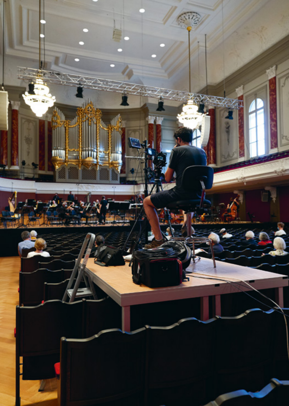
Schlusskonzerte im Pandemie-Modus: Streaming im Stadtcasino (fast) ohne Publikum